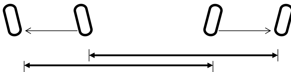
Figura 2.- Separació més estreta: El desplaçament lateral és més llarg